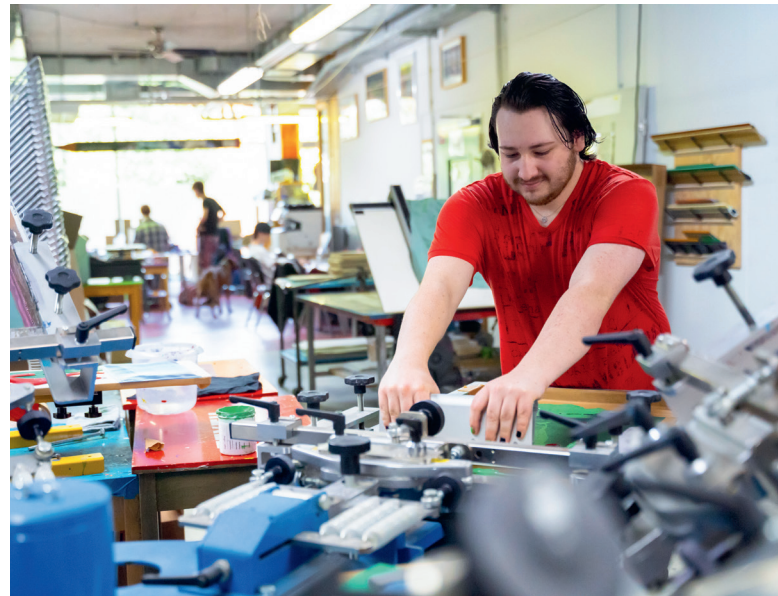
Die Auszubildenden lernen die verschiedenen Bereiche des Siebdruckhandwerks von der Pike auf.

Qualifikanten und sieben Auszubildende, angeleitet von einer Grafikerin, einer Siebdruckmeisterin und einem Siebdruck-Anleiter, lernen verschiedene Bereiche des Siebdruckhandwerks von der Pike auf (Medienvorstufe, z. B. Datenbearbeitung; Druckvorstufe, z. B. Filmerstellung, Druckformherstellung; Textilsieb-